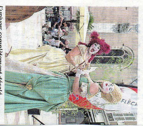
L'univers complètement décalé